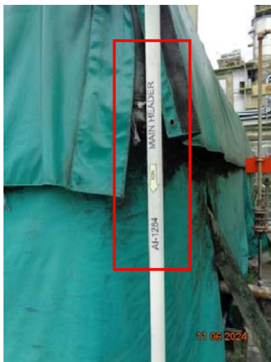
รูปที่ 3.1-15 ระบบท่อ Minimum Flow Line