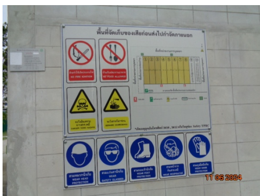
รูปที่ 3.1-27 ป้ายเตือนอันตรายต่างๆ