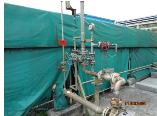
รูปที่ 3.1-14 ระบบ Pressure Gauge