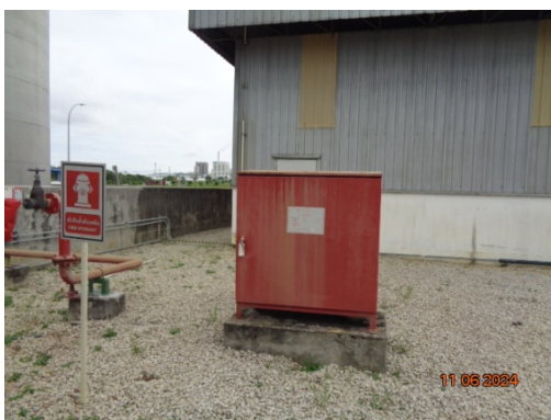
รูปที่ 3.1-33 Fire Hose Box