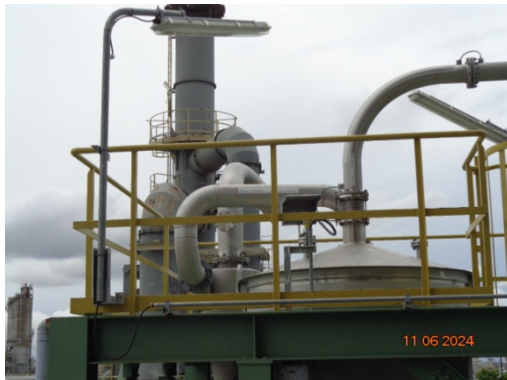
รูปที่ 3.1-7 Cyclone ชุดที่ 5 MC-1462