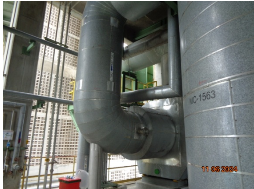
รูปที่ 3.1-5 Cyclone ชุดที่ 2 MC-1563