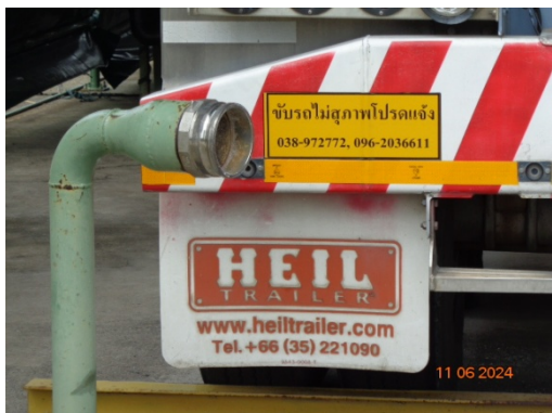
รูปที่ 3.1-23 การติดป้ายชื่อและหมายเลขโทรศัพท์ ที่โรงงานส่งผลิตภัณฑ์ และสารเคมี