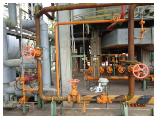
รูปที่ 3.1-46 วาล์วตัดแยกระบบท่อขนส่ง ก๊าซธรรมชาติ

รูปที่ 3.1 ภาพถ่ายประกอบการปฏิบัติตามมาตรการป้องกันและแก้ไขผลกระทบ สิ่งแวดล้อม โครงการโรงงานผลิต Polyethylene Terephthalate (PET) (ระยะดำเนินการ) บริษัท ไทย เพ็ท เรซิน จำกัด (ต่อ)