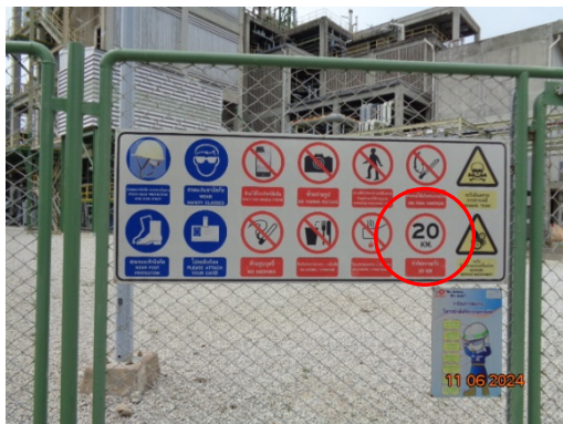
รูปที่ 3.1-21 ป้ายจำกัดความเร็ว