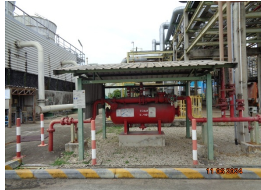
รูปที่ 3.1-32 ระบบโฟมดับเพลิง