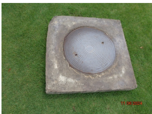
รูปที่ 3.1-9 Septic Tank