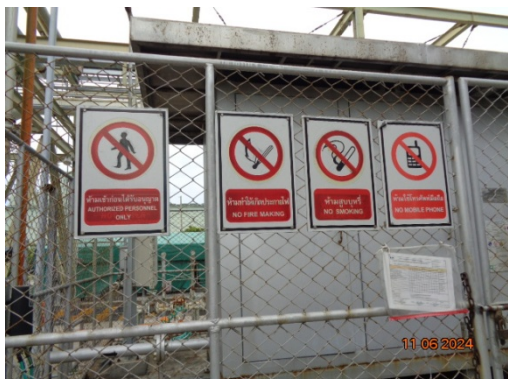
รูปที่ 3.1-47 ป้ายเตือน และระดับเพลิง บริเวณท่อขนส่งก๊าซธรรมชาติ