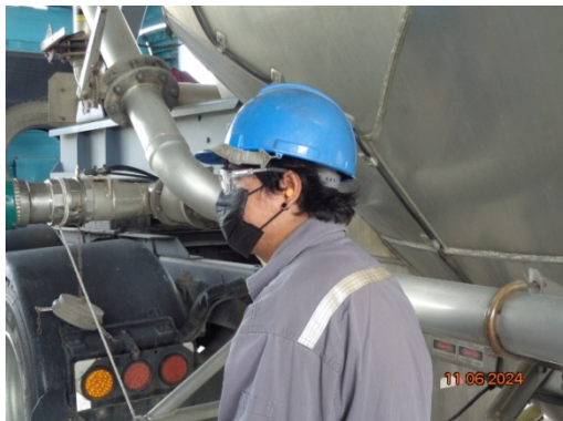
รูปที่ 3.1-19 พนักงานสวมใส่อุปกรณ์ป้องกันเสียง