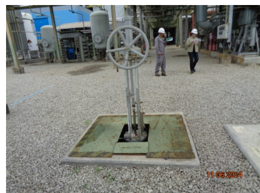
รูปที่ 3.1-16 วาล์วตัดแยกระบบบำบัดน้ำเสีย

รูปที่ 3.1 ภาพถ่ายประกอบการปฏิบัติตามมาตรการป้องกันและแก้ไขผลกระทบ สิ่งแวดล้อม โครงการโรงงานผลิต Polyethylene Terephthalate (PET) (ระยะดำเนินการ) บริษัท ไทย เพ็ท เรซิน จำกัด (ต่อ)