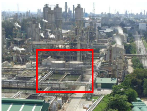
รูปที่ 3.1-37 บ่อน้ำสำรองในการดับเพลิง ของบริษัท จีซี-เอ็ม พีทีเอ จำกัด