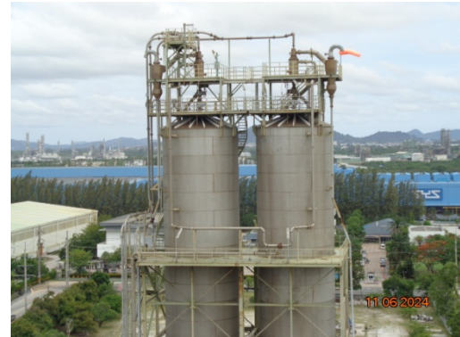
รูปที่ 3.1-6 Cyclone ชุดที่ 3 และ 4 (MC-1614 และ MC-1624)