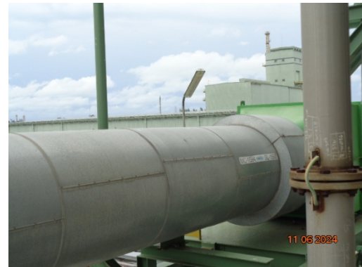
รูปที่ 3.1-8 Cyclone ชุดที่ 6 MC-1594