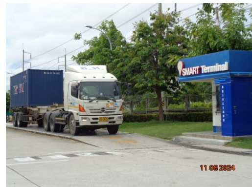
รูปที่ 3.1-22 พื้นที่ซังน้ำหนักรถ

รูปที่ 3.1 ภาพถ่ายประกอบการปฏิบัติตามมาตรการป้องกันและแก้ไขผลกระทบ สิ่งแวดล้อม โครงการโรงงานผลิต Polyethylene Terephthalate (PET) (ระยะดำเนินการ) บริษัท ไทย เพ็ท เรซิน จำกัด (ต่อ)