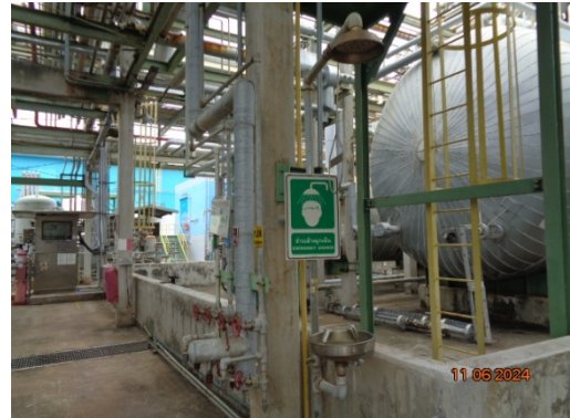
รูปที่ 3.1-30 ฝักบัวและอ่างล้างตาฉุกเฉิน