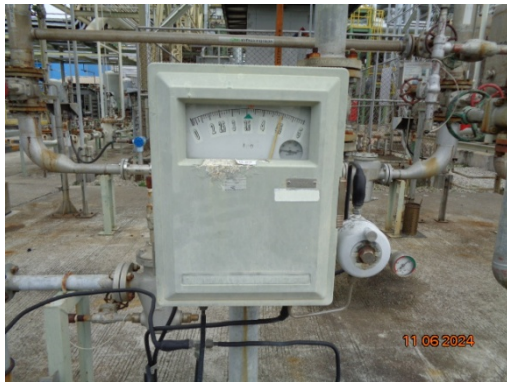
รูปที่ 3.1-13 ระบบ Flow Meter