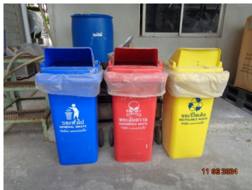
รูปที่ 3.1-24 ถึงขยะภายในพื้นที่โครงการ