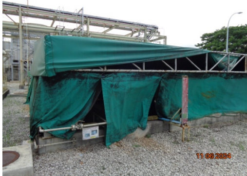
รูปที่ 3.1-11 Neutralization Pond