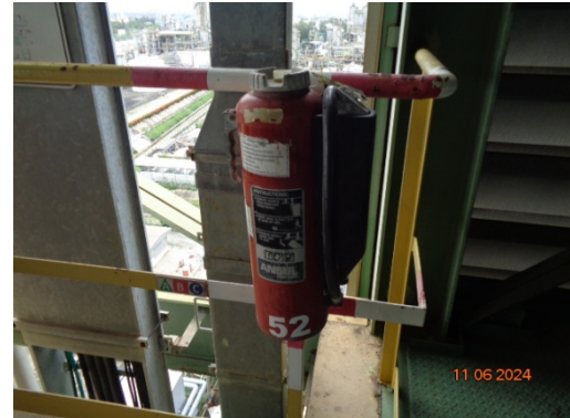
รูปที่ 3.1-36 ถังดับเพลิง