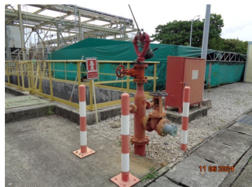
รูปที่ 3.1-34 Fire Hydrant

รูปที่ 3.1 ภาพถ่ายประกอบการปฏิบัติตามมาตรการป้องกันและแก้ไขผลกระทบ สิ่งแวดล้อม โครงการโรงงานผลิต Polyethylene Terephthalate (PET) (ระยะดำเนินการ) บริษัท ไทย เพ็ท เรซิน จำกัด (ต่อ)