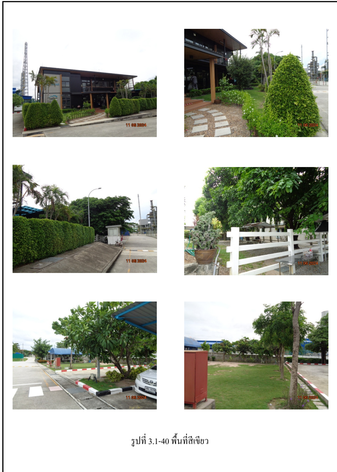
รูปที่ 3.1-40 พื้นที่สีเขียว

รูปที่ 3.1 ภาพถ่ายประกอบการปฏิบัติตามมาตรการป้องกันและแก้ไขผลกระทบสิ่งแวดล้อม โครงการโรงงานผลิต Polyethylene Terephthalate (PET) (ระยะดำเนินการ) บริษัท ไทย เพ็ท เรซิน จำกัด (ต่อ)