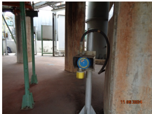
รูปที่ 3.1-31 Gas Detector