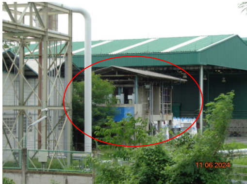
รูปที่ 3.1-17 ระบบบำบัดน้ำเสียเดิมของโครงการ