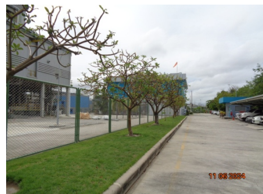
รูปที่ 3.1-40 พื้นที่สีเขียว (ต่อ)

รูปที่ 3.1 ภาพถ่ายประกอบการปฏิบัติตามมาตรการป้องกันและแก้ไขผลกระทบ สิ่งแวดล้อม โครงการโรงงานผลิต Polyethylene Terephthalate (PET) (ระยะดำเนินการ) บริษัท ไทย เพ็ท เรซิน จำกัด (ต่อ)