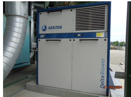
รูปที่ 3.1-20 ที่ครอบเครื่องจักรป้องกันเสียง