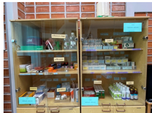
รูปที่ 3.1-39 ห้องพยาบาลและอุปกรณ์ปฐมพยาบาล

รูปที่ 3.1 ภาพถ่ายประกอบการปฏิบัติตามมาตรการป้องกันและแก้ไขผลกระทบ สิ่งแวดล้อม โครงการโรงงานผลิต Polyethylene Terephthalate (PET) (ระยะดำเนินการ) บริษัท ไทย เพ็ท เรซิน จำกัด (ต่อ)