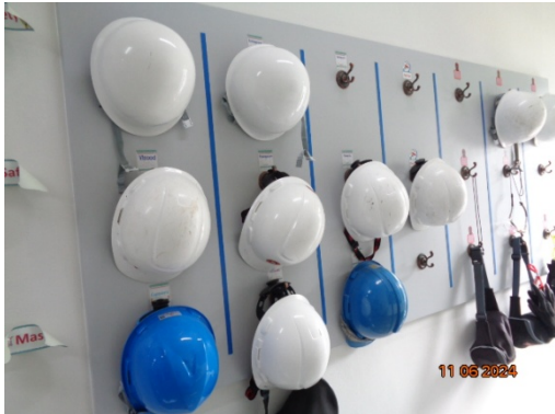
รูปที่ 3.1-29 อุปกรณ์คุ้มครองความปลอดภัย ส่วนบุคคล