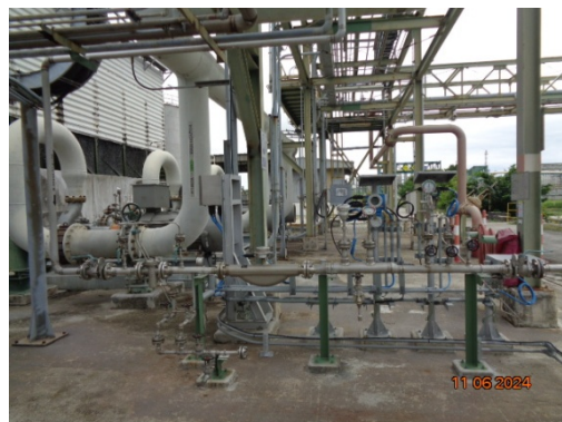
รูปที่ 3.1-48 Pressure Relief Valve