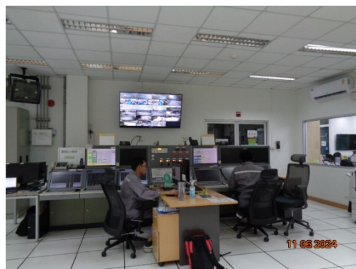
รูปที่ 3.1-44 Distributed Control System (DCS)