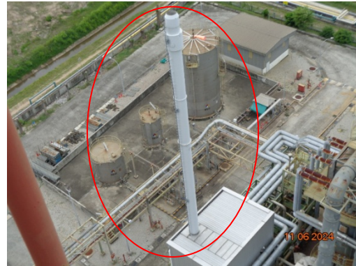
รูปที่ 3.1-2 ปล่องระบายอากาศ HTM Heater ชุดที่ 2 (F-1901-2)