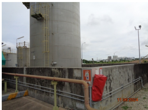
รูปที่ 3.1-41 คั่นคอนกรีตรอบพื้นที่เก็บสารเคมี