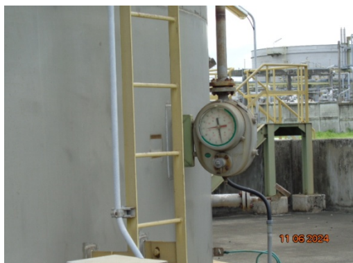
รูปที่ 3.1-43 อุปกรณ์วัดระดับสารเคมี (Level Indicator, Level Gauge)