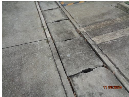
รูปที่ 3.1-26 รางระบายน้ำฝน