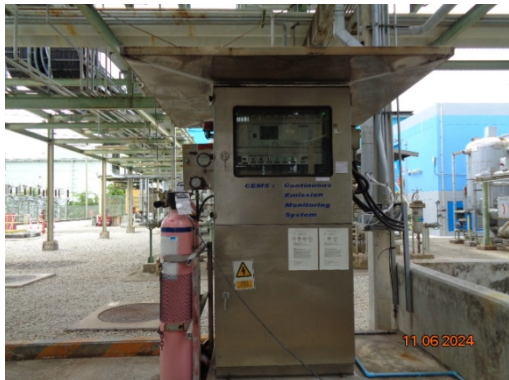
รูปที่ 3.1-3 Continuous Emission Monitoring System, CEMS