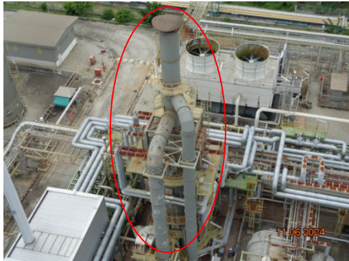
รูปที่ 3.1-1 ปล่องระบายอากาศ HTM Heater ชุดที่ 1 (F-1901)