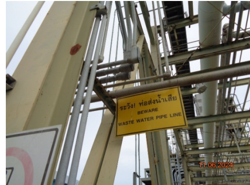
รูปที่ 3.1-12 ป้ายเตือนบริเวณแนวท่อขนส่งน้ำเสีย