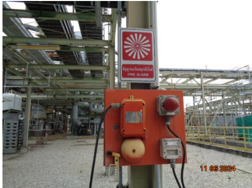
รูปที่ 3.1-35 Fire Alarm