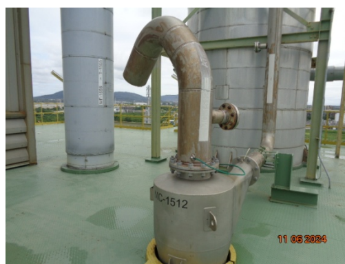
รูปที่ 3.1-4 Cyclone ชุดที่ 1 MC-1512

รูปที่ 3.1 ภาพถ่ายประกอบการปฏิบัติตามมาตรการป้องกันและแก้ไขผลกระทบสิ่งแวดล้อม โครงการโรงงานผลิต Polyethylene Terephthalate (PET) (ระยะดำเนินการ) บริษัท ไทย เพ็ท เรซิน จำกัด