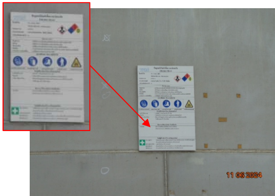
รูปที่ 3.1-28 การติดป้าย SDS ของสารเคมี