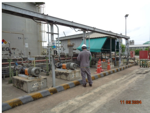
รูปที่ 3.1-49 เจ้าหน้าที่เดินตรวจสอบการรั่วไหลและเหตุการณ์ผิดปกติรอบถังกักเก็บ และแนวท่อขนส่งโมโนเอทรีลีนไกลคอล