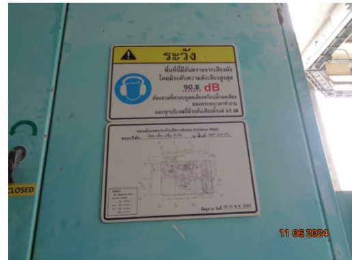
รูปที่ 3.1-18 ป้ายเตือนในบริเวณที่มีเสียงดัง