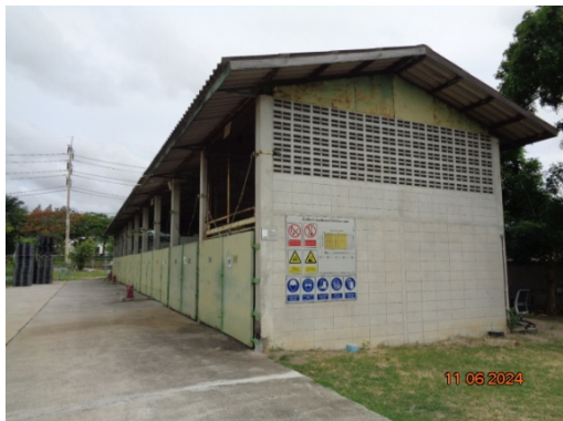
รูปที่ 3.1-25 อาคารเก็บกากของเสีย