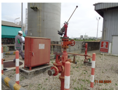
รูปที่ 3.1-50 Fire Hydrant บริเวณท่อขนส่งก๊าซธรรมชาติ

รูปที่ 3.1 ภาพถ่ายประกอบการปฏิบัติตามมาตรการป้องกันและแก้ไขผลกระทบ สิ่งแวดล้อม โครงการโรงงานผลิต Polyethylene Terephthalate (PET) (ระยะดำเนินการ) บริษัท ไทย เพ็ท เรซิน จำกัด (ต่อ)