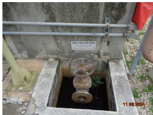
รูปที่ 3.1-42 Block Valve