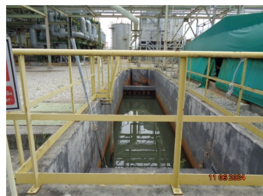
รูปที่ 3.1-10 Oil Separator

รูปที่ 3.1 ภาพถ่ายประกอบการปฏิบัติตามมาตรการป้องกันและแก้ไขผลกระทบ สิ่งแวดล้อม โครงการโรงงานผลิต Polyethylene Terephthalate (PET) (ระยะดำเนินการ) บริษัท ไทย เพ็ท เรซิน จำกัด (ต่อ)