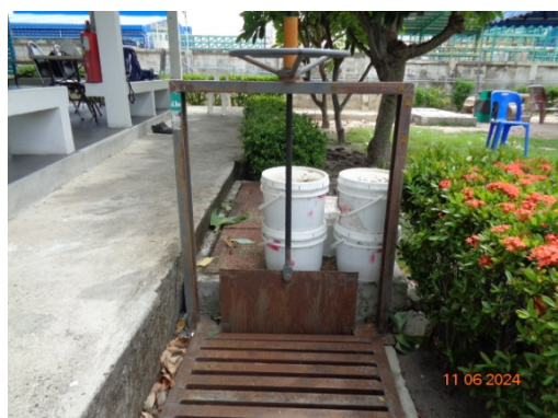
รูปที่ 3.1-45 วัสดุดูดซับของเหลวที่หกแล้วไหล